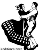
Landsforeningen Danske Folkedansere Region Syddanmark

Solen står op og svinder i farver, milevidt hav får skyernes glød. Sømanden sejler mod horisonten, føler sig fri som de bølger der brød. Skinnende hav, glitrer som rav, vindstille dage du sømanden gav. Lettere klang, bølgerne sang, hør det endnu en gang.