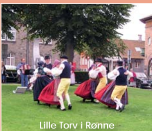
Lille Torv i Rønne

Vi sørger for, at jeres opvisninger bliver omtalt i de lokale medier og publikationer, som henvender sig til lokalbefolkningen og Bornholms mange gæster.