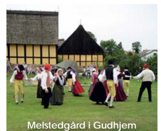
Melstedgård i Gudhjem