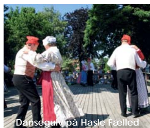
Dansegrube på Hasle Fælled